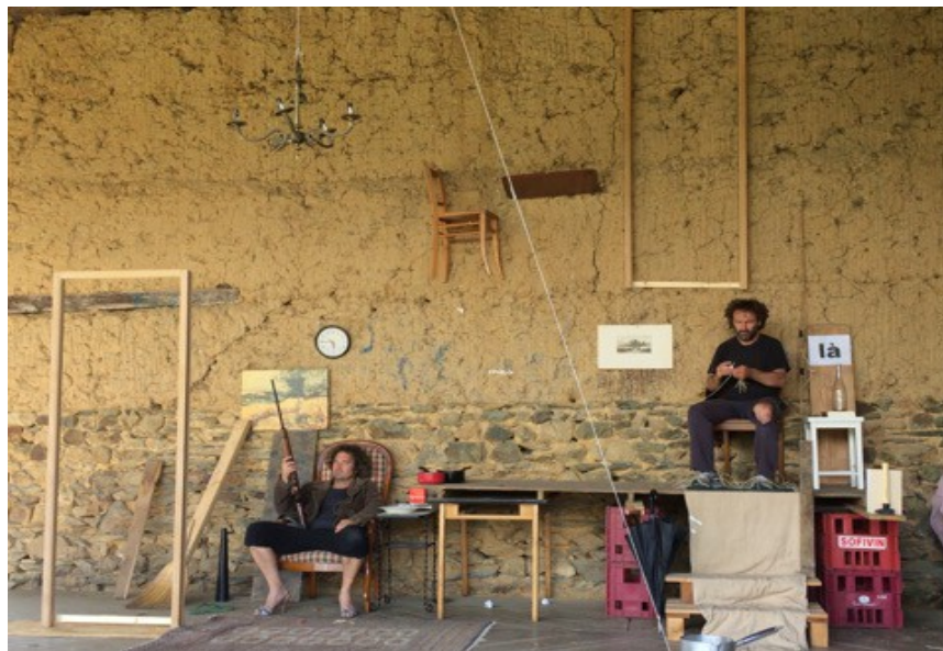
1ère résidence d'expérimentation « Au bout du Plongeur » Domaine de Tizé / juillet 2018