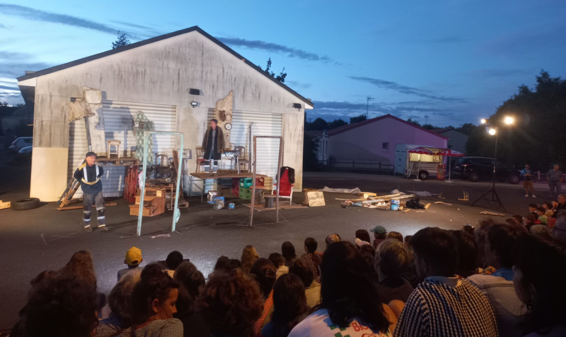
Photo: spectacle MURAIÉ - Festival Rendez-vous en terrain connu à Chemillé-en- Anjou ; Été 2025