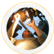
Fabrice CHAINON, régisseur

Depuis dix ans, il a réalisé 143 décors pour 84 structures différentes, ce qui en fait un acteur majeur dans le domaine en Bretagne. Le lieu, installé dans un ancien garage de 800 m 2 , sert de plateforme mutualisée pour la construction de décors et accueille également des projets pédagogiques, notamment pour les scolaires.